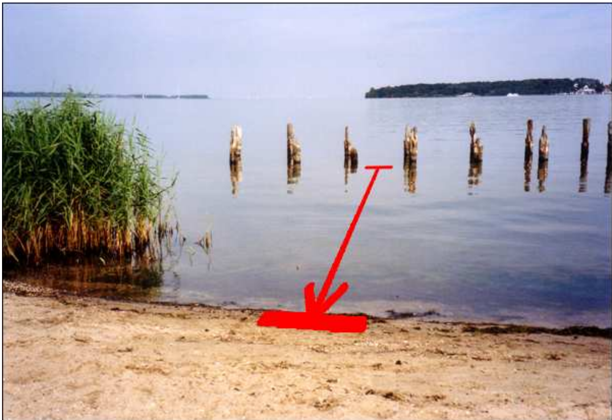
Küstenrückgang von 14m

Anhand der verbliebenen Bühnen, die ehemals direkt am Ufer des Spülfeldes zum Schutz vor Abtragung errichtet wurden, kann man nun erkennen, dass ein Rückgang des Ufers stattgefunden hat: