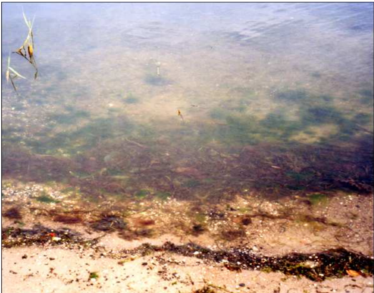
Algen und Kiesel in Strandnähe

An dem verschwindend geringen Anteil von Schwebstoffen des kalten Wassers lässt sich schon die geringe Belastung von organischem sowie anorganischem Material erkennen. Durch die Messwerte von Phosphat, Nitrat und Nitrit wird diese Vermutung bestätigt. Der Anteil aller Nährstoffe liegt weit unter den Grenzwerten der Trinkwasserverordnung, die zwar nicht als Referenz für z.B. die Algenvegetation genommen werden können, aber dennoch verdeutlichen, dass die Lebensbedingungen für eine große Artenvielfalt und Anzahl an Algen – als Indikator für nährstoffreiches Wasser – eingeschränkt sind. Man findet vorwiegend Grün- und Braunalgen sowie Blasentang vor.