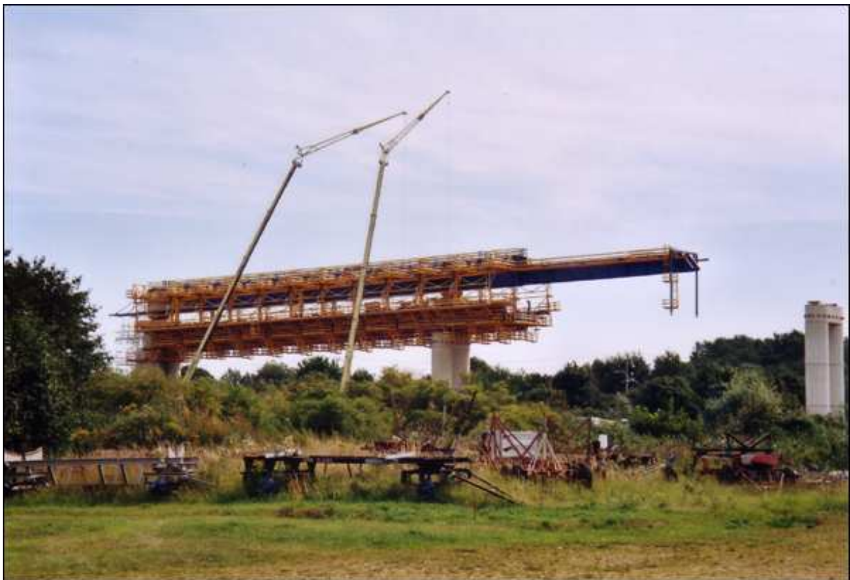
Bau der zweiten Sundquerung auf dem nördlichen Dänholm

Nach der Wende ging der DDR-Betrieb ein und mit der Zeit begrünzte sich das Gebiet. Zurzeit wird das Spülfeld zum Bau der zweiten Sundquerung genutzt.