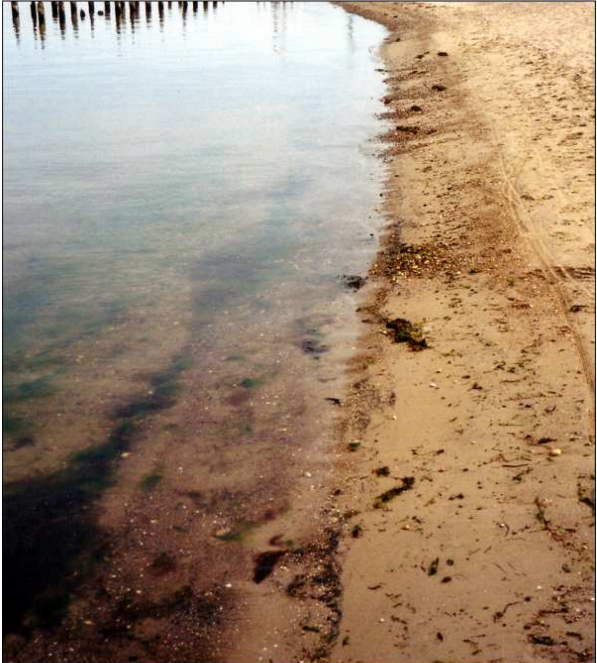
Sortierung des Kiesel

Auf dem Grund des Gewässers findet sich ein Grobkiesfächer als Folge der Bau- und Umlagerungsmaßnahmen von Ostseekies, der am Spülfeld angelagert wurde. Bei Sturmfluten kann sogar der gesamte Küstenbereich überspült werden, wobei das Wasser abfließt und der Kies zurückbleibt. Durch den Wellenschlag findet am Strand eine Sortierung von gröberem und feinerem Kies statt.